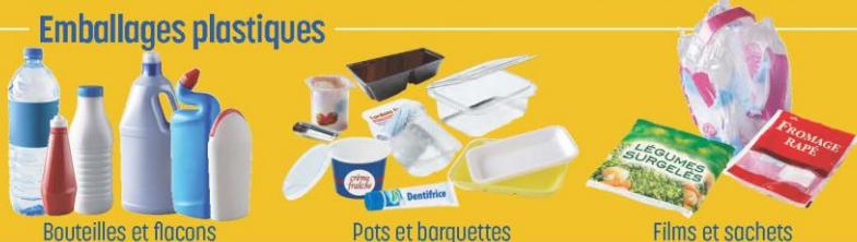
Bouteilles et flacons